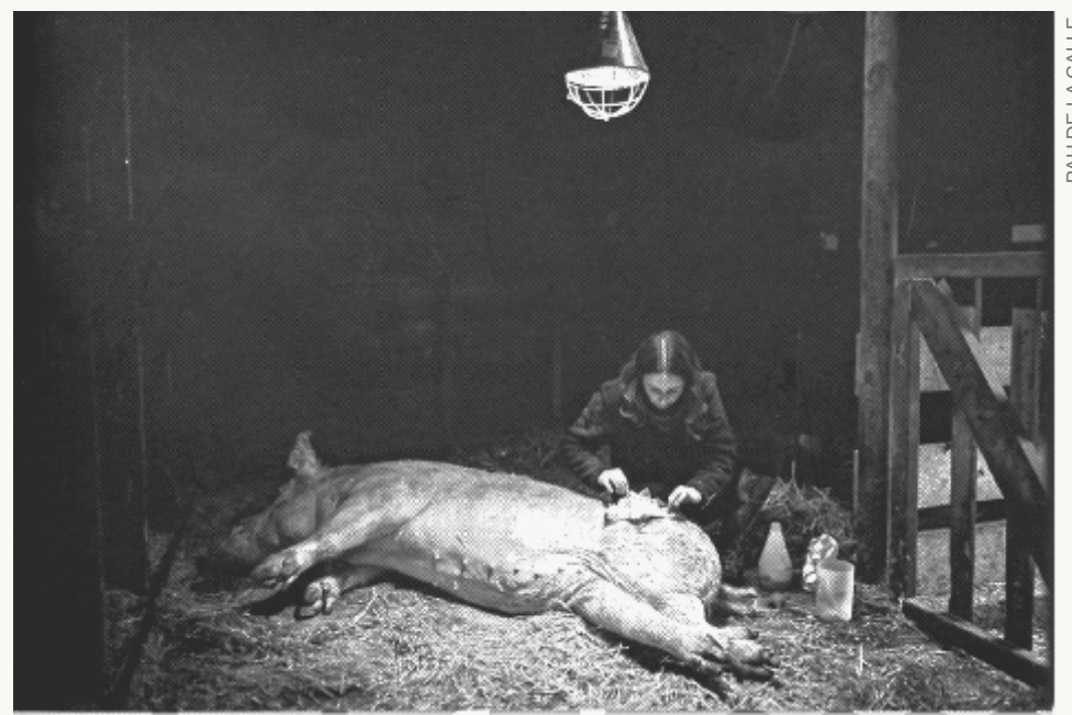
PAU DE LA CALLE

Del 7 al 29 de febrer, de dilluns a divendres de 10 a 20 h Casa de Cultura de Girona, sala d'exposicions de la primera planta