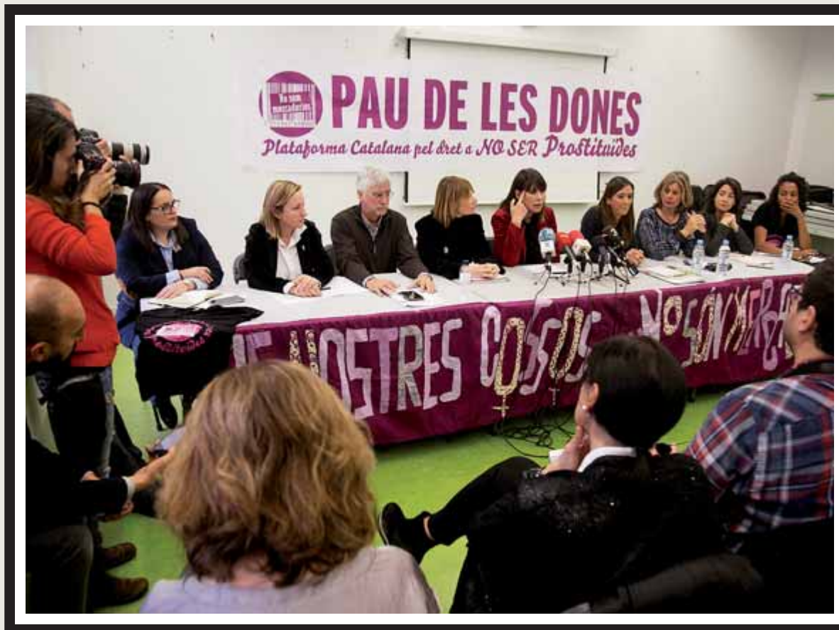
Taula rodona organitzada per la Xarxa Catalana de Municipis Lliures de Tràfic de Persones

A la frontera dona la benvinguda el club nocturn més gran d'Europa, que anuncia la festa del retorn a l'escola amb simpàtiques estudiants perfectament uniformades a la part vestida del seu cos. En les seves diferents sales, terrasses, bars, espais privats, s'ofereixen còctels, copes, ambients house i techno house, espectacles exclusius i atencions personalitzades a càrrec de les senyorettes vingudes d'arreu del món que més agradin al client, moments íntims inoblidables, habitacions... Un de tants llocs de relax, entreteniment i oci perquè aquests homes tan normals -captats al dibuix de Pep Dui-xans- puguin satisfer les fantasies més profundes de la seva ànima.