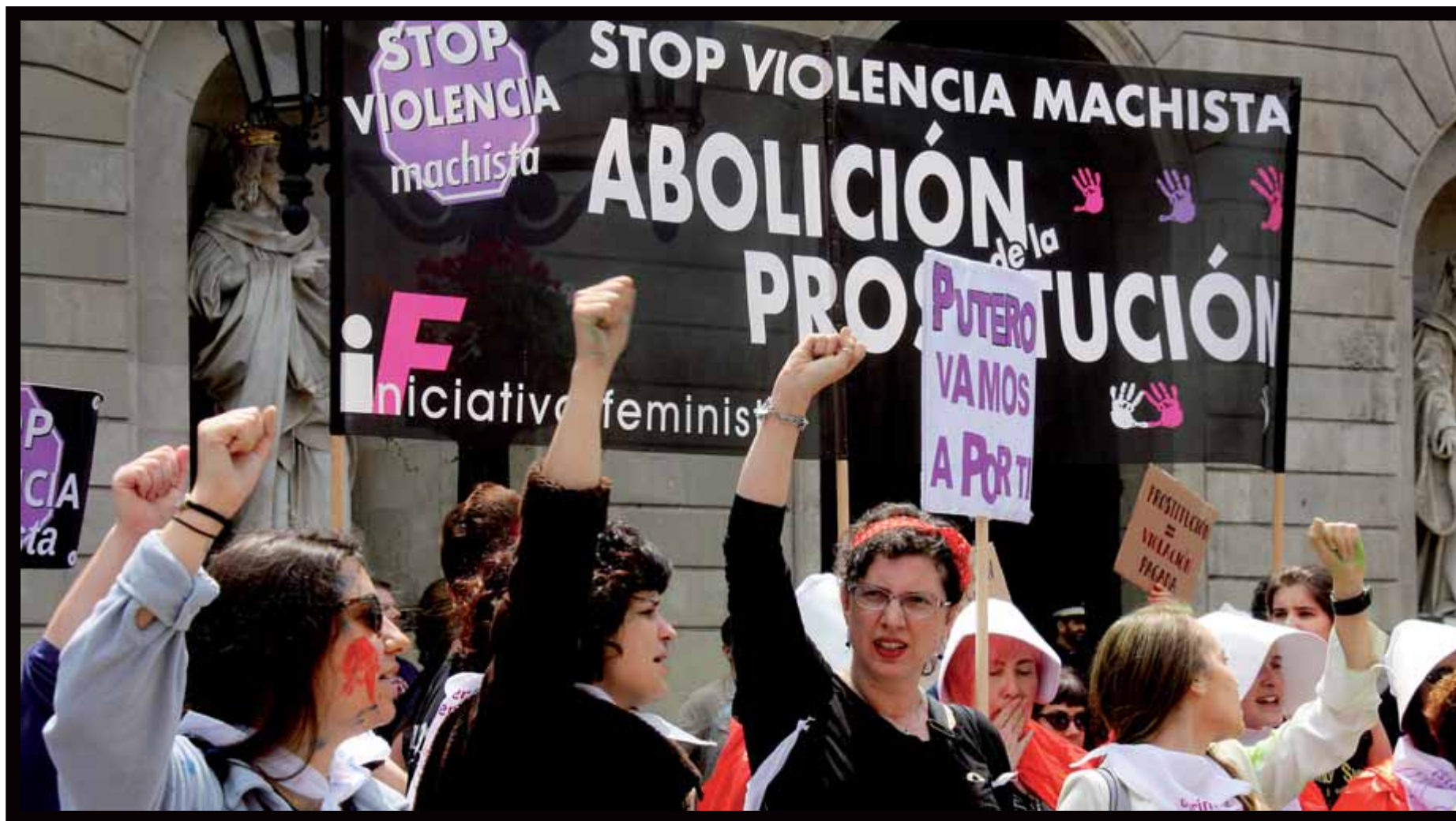
Manifestació a la plaça Sant Jaume a favor de l'abolició de la prostitució.